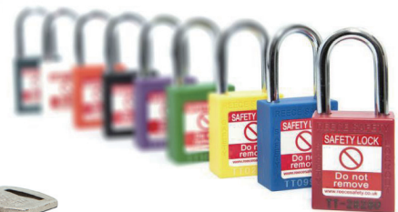
スチール製シャックル