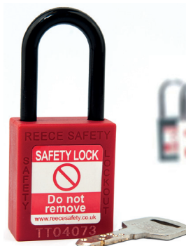
プラスチック製シャックル (非導電性)